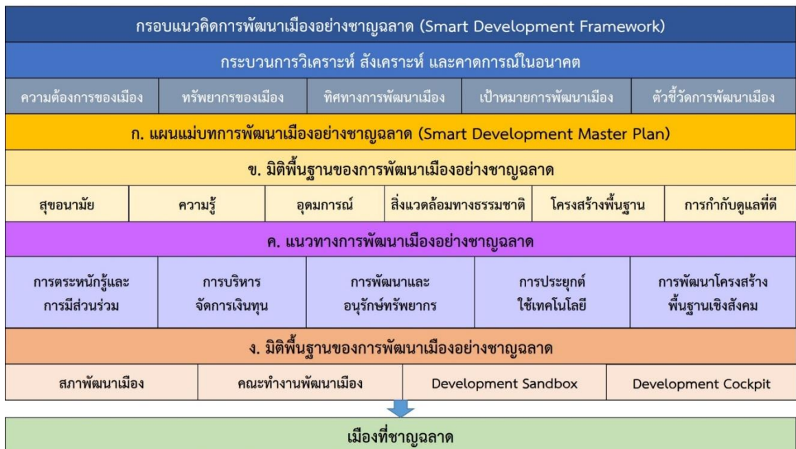
แผนภาพที่ ๑ : กรอบแนวคิดในการพัฒนาเมืองอย่างชาญฉลาด

ทั้งนี้แต่ละประเด็นของการพัฒนาเมืองอย่างชาญฉลาดนั้นจะมีลำดับขั้นตอนของการกำหนดแต่ละประเด็นอย่างชัดเจนและแต่ละประเด็นก็มีความเชื่อมโยงกัน โดยมีรายละเอียดของแต่ละประเด็นดังต่อไปนี้